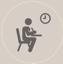
විභාගයක විශ්වාසනීයත්වයට හානි විය හැකි ආකාරයේ තොරතුරු