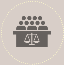
අධිකරණයට අගෞරවයක් විය හැකි ආකාරයේ තොරතුරු