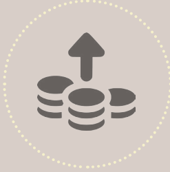
ශ්‍රී ලංකාවේ ආර්ථිකයට හානිකර ආකාරයේ තොරතුරු