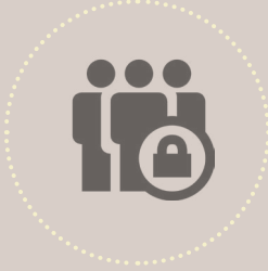
ජාතික ආරක්ෂාවට හානියක් විය හැකි ආකාරයේ තොරතුරු