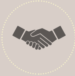
විශ්වාසය මත ගොඩනැගුණු සම්බන්ධතාවයක් මත පදනම්වූ තොරතුරු (උදා: සේවාලාභියෙකු විසින් ඔහුගේ/ඇයගේ නීතිඥයා වෙත ලබා දෙන තොරතුරු)