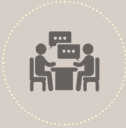
වෘත්තීයවේදියෙක් හා මහජන ආයතනයක් අතර සිදුවූ සන්නිවේදනයන්