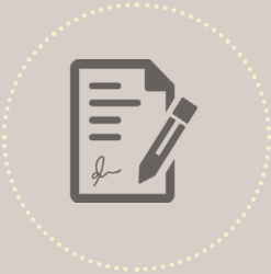
තිරණයක් ගෙන නොමැති යම් යම් අමාත්‍ය මණ්ඩල සංදේශ