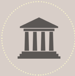
පාර්ලිමේන්තුවේ/පළාත්සභාවල වරප්‍රසාද උල්ලංඝනය වන ආකාරයේ තොරතුරු